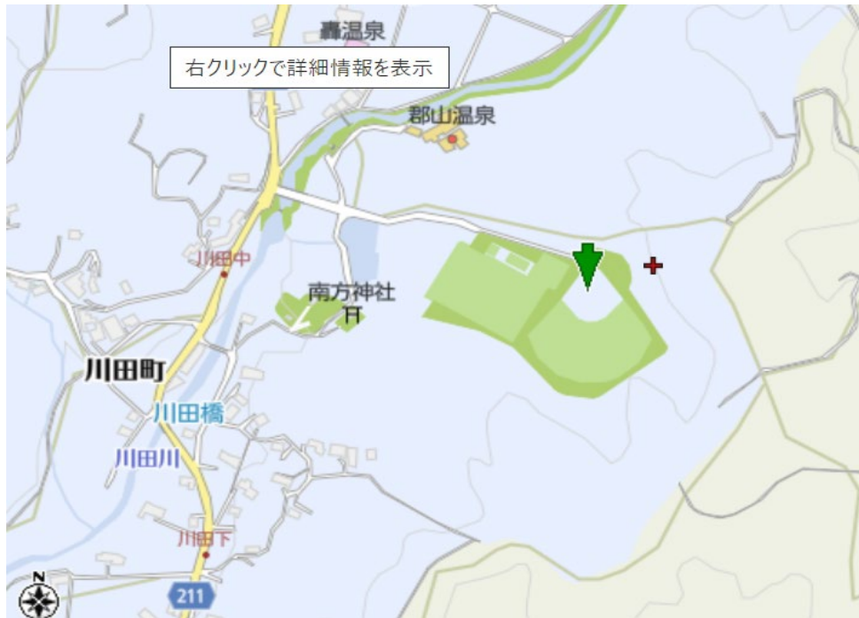
鹿児島相互信用金庫郡山総合グラウンド/野球場